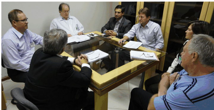
Diretorias da SEPAM, Cabergs e Gerente Geral da Agência Banrisul de Ijuí.

Em linha com as ações de interiorização, desenvolvidas com prioridade pela atual gestão da Cabergs e divulgadas constantemente, foram agregados 77 novos profissionais médicos na rede credenciada no município de Ijuí , região Noroeste do Rio Grande do Sul. Até então, os beneficiários residentes na cidade contavam com o atendimento de profissionais, em sua maioria, através do convênio firmado com o Hospital de Caridade de Ijuí (HCI), que existe desde 1935. Hoje, seu atendimento vai além dos mais de 78 mil habitantes da localidade e alcança 1,5 milhão de pessoas que fazem parte de uma região formada por 120 municípios.