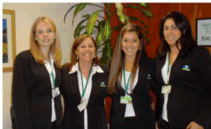
Equipe do Serviço Social.

O contato com o Setor de Serviço Social pode ser feito através do telefone (51)3210-9707 ou pelo e-mail servicosocial@cabergs.org.br