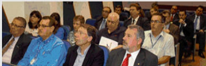
Representantes das entidades.

Em uma iniciativa inédita a CABERGS promoveu no dia 04 de abril, no auditório da FBSS, um encontro para o lançamento do Fórum Permanente de Saúde - FPS. Criado para ser um canal contínuo de colaboração entre a CABERGS e entidades representativas, o objetivo do FPS é acompanhar, divulgar, colaborar e sugerir ações visando a melhoria da qualidade de vida e do modelo de assistência médio-hospitalar e odontológico oferecidos pela CABERGS. Na ocasião em que foi apresentado também o Regimento do FPS, estiveram presentes representantes da AFABAN, ASBERGS, AGEPA, AGBAN, FETRAFI, SindBancários, URGEBAN, CIPAs Ag. Central e CABERGS, SESMT Banrisul e colaboradores da CABERGS. Previstos para ocorrerem trimestralmente, os encontros do FPS serão conduzidos por um coordenador indicado pela CABERGS e dois representantes de cada entidade convidada.